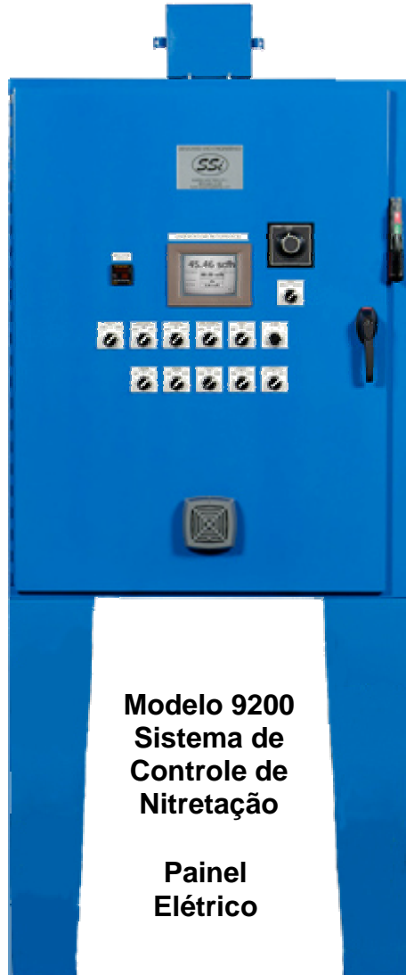
Modelo 9200 Sistema de Controle de Nitretação