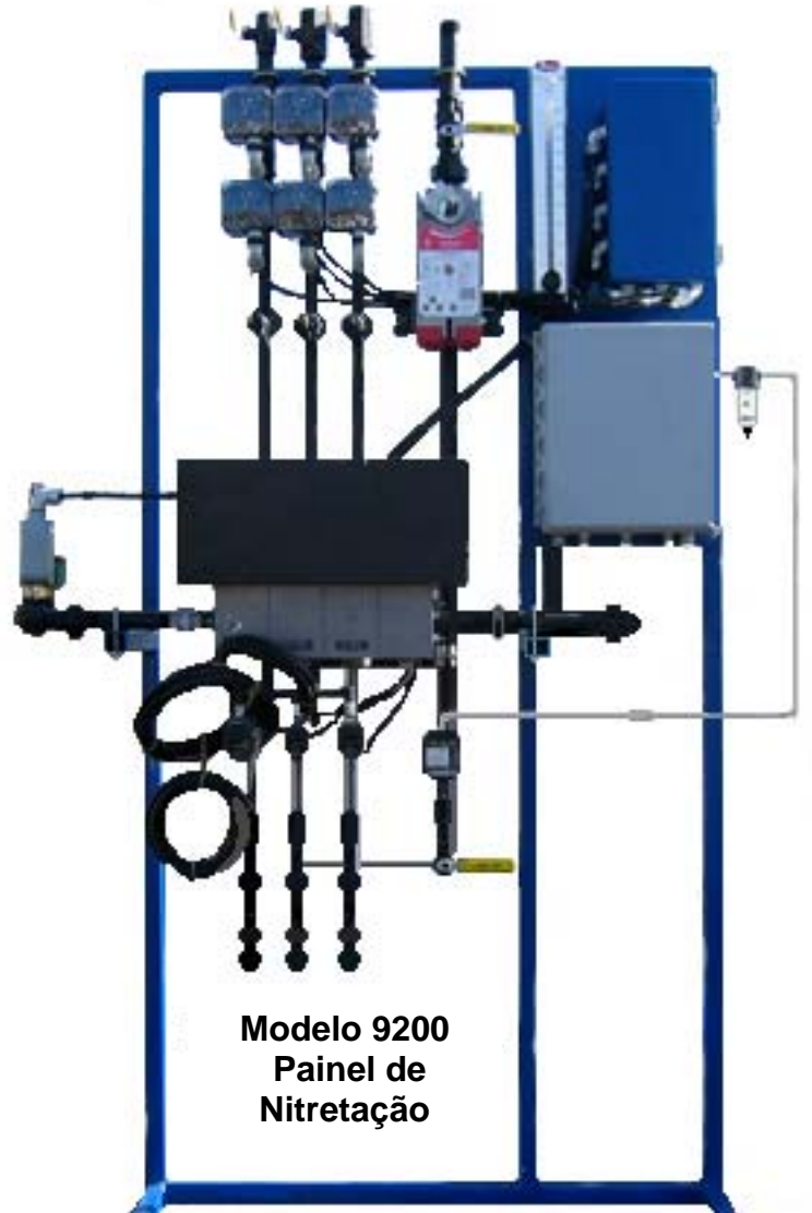
Modelo 9200 Painel de Nitretação